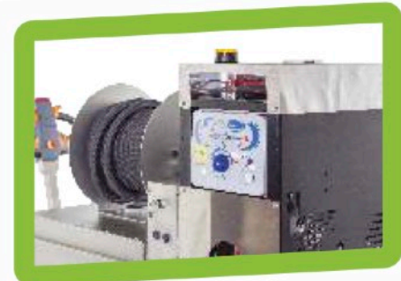
90KW Heizölbrenner mit Temperaturvorwahl und Störungsanzeige