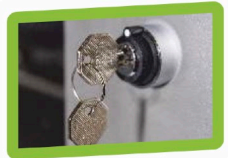
Schlüsselschalter für die Freigabe vom Fahrtrieb und Brenner