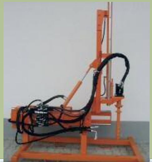
Abstell-Rahmenbock mit Einfahrtaschen – UVV (Stapler, Lader, etc.)

Entwickelt auf CAD, gefertigt mit modernster CNC Technik