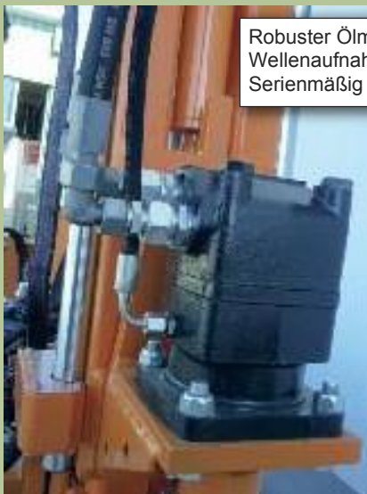
Robuster Ölmotor mit Vorsatzlagerung Wellenaufnahme Ø 40 mm und Flanschschluss Serienmäßig Lecköl-Rücklauf (kein Staudruck)